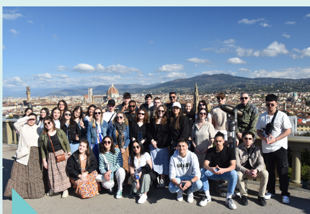
Italiëreis (6 de jaar bovenbouw) – april 2023