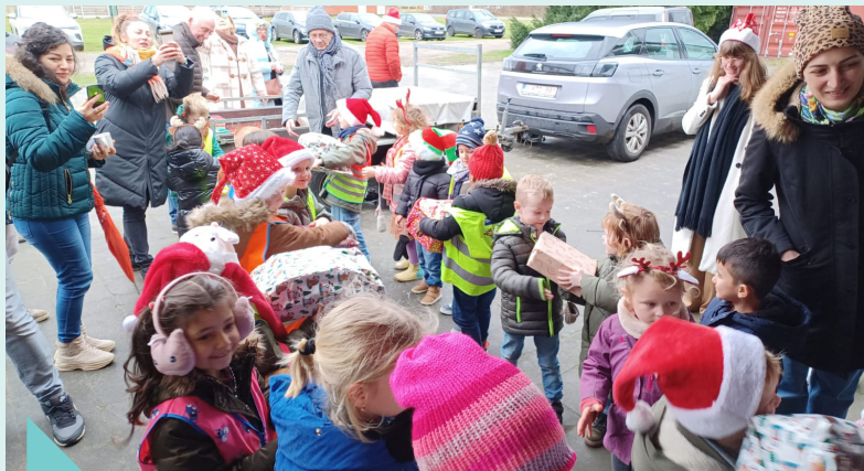
Schoenmaatjes t.v.v. Sint-Vincentius – december 2023