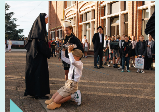
100 jaar Sint-Michel – september 2023