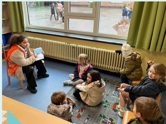
Voorleesweek – november 2023