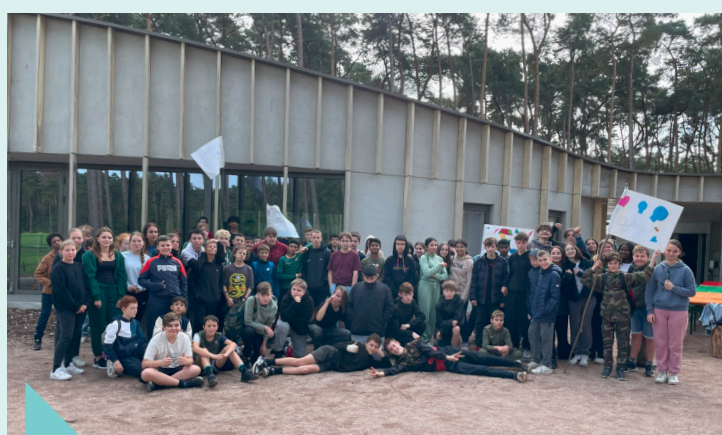
Tweedaagse in Hoge Kempen (2 de jaar middenschool) – oktober 2023